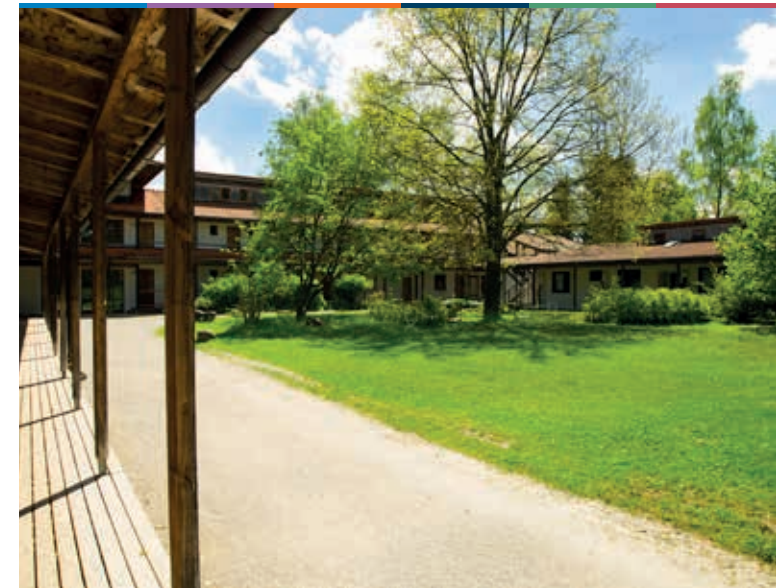
FORTBILDUNG – WORKSHOP

Systemische Therapie mit der inneren Familie