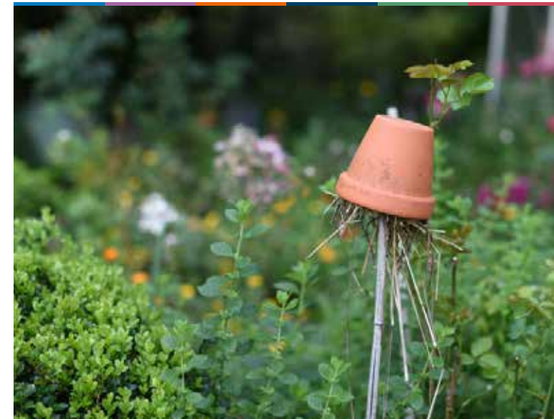
FORTBILDUNG – WORKSHOP