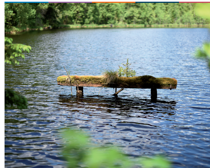
FORTBILDUNG – SERIE

Der vergebliche Versuch, ein wesentliches Bedürfnis mit Ersatz zu stillen.