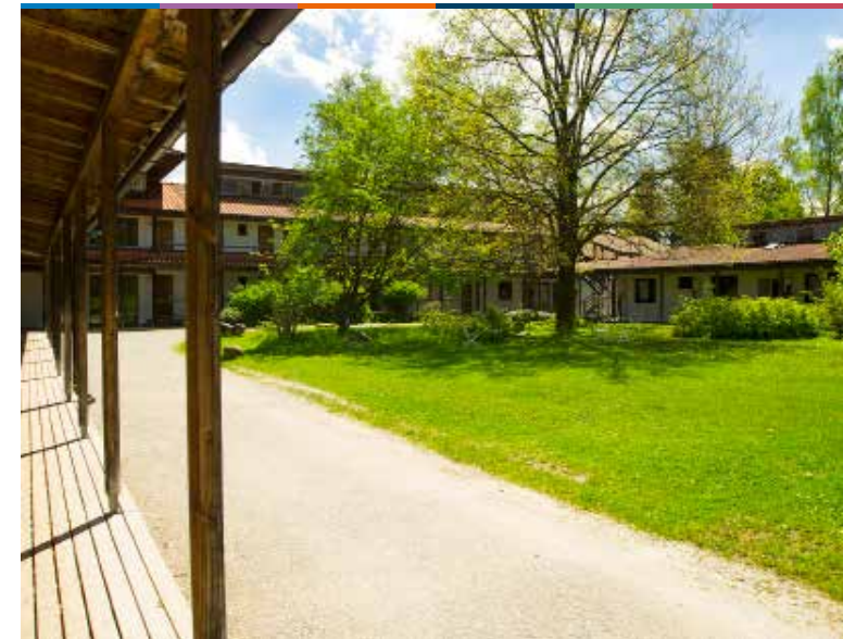
FORTBILDUNG – WORKSHOP